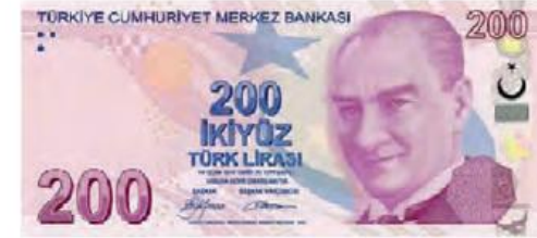
İki yüz Türk lirası