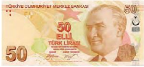
Elli Türk lirası

Görseldeki paraları inceleyelim. Paraların değerlerini altındaki noktalı yerlere yazalım.