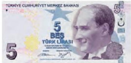
Beş Türk lirası