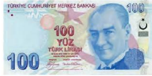
Yüz Türk lirası

Paraları değerlerine göre küçükten büyüğe doğru sıralayalım.