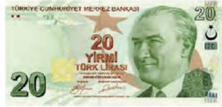
Yirmi Türk lirası