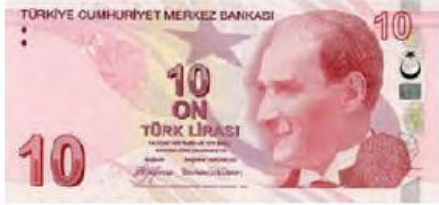
On Türk lirası